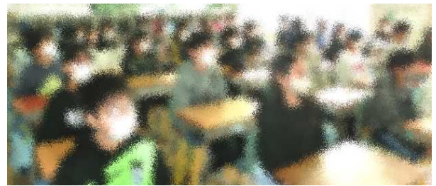
*放送による全校集会で校長先生の話を真剣に聞く6年生

2校時には、放送による全校集会を行い、よい姿勢で話を聞くなど、冬休み明けの初日にはありますが、木ノ下小学校の児童が持っているよさを再認識できた日になりました。