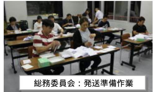
総務委員会：発送準備作業

「幌呂の歌」を祝賀会で一緒に歌ってみませんか。 練習用CDと歌詞カードが学校にありますので、希望する方は学校へご連絡ください。