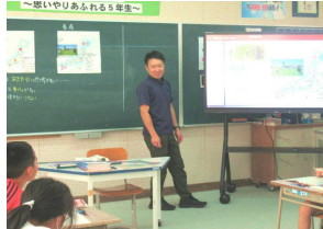
5年 社会科で資料提示

7月29日に電子黒板が新たに3台納入されました。パソコンやタブレットをつながなくてもインターネットにも接続できる優れものです。納入翌日から、早速授業で活用しています。