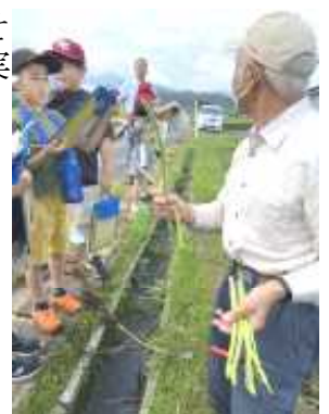
3年 アスパラ畑にて