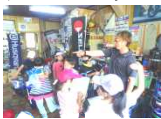
2年 サイクルハセベにて