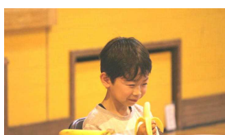
バナナの食リポに挑戦しました